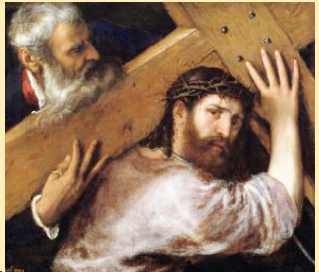
Cristo con la Cruz a-cuestas. Tiziano (1490-1576). Es conserva al Museu de El Prado

Dimarts i dijous, de SIS a SET de la tarda.