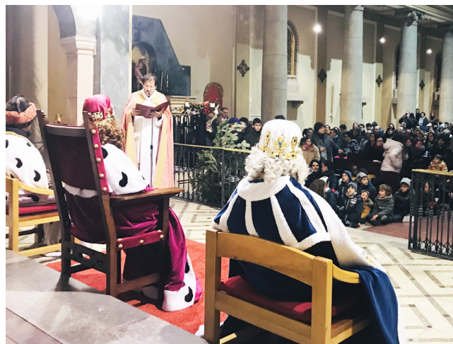
Adoració dels reis a l'infant Jesús a l'església parroquial.

En aquestes, els reis van fer senyals indicant que haurien de començar a passar, i el patge de formes elegants i refinades es retirà molt discretament. Per la manera d'acostar-se al rei ros vaig comprendre que havia de ser de la seva confiança. Quan ja sortien de la sala de plens, acompanyats pel Sr. Alcalde, vaig veure que em saludava amb una mirada de cua d'ull. Vaig quedar amb molts interrogants. Però vaig entendre que tenim un gran desconeixement sobre els reis d'Orient.