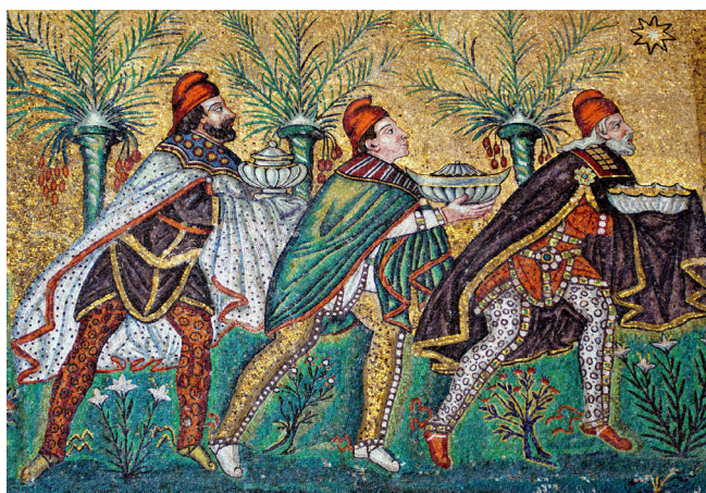
Mosaic de la Basílica de Sant Apollinare Nuovo, a Ravenna. Datats al segle VI. Els mags, amb gorro frigi, a l'estil persa.