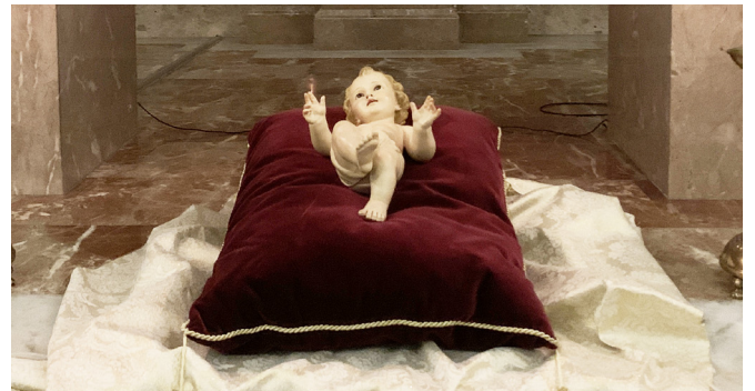
Nen Jesús a la capella fonda

Dilluns passat, primer de mes, vam trobar-nos tal com fem cada primer dilluns de mes. Un temps de silenci contemplatiu, aquesta vegada a través de la mirada del nen Jesús. El temps de Nadal i Epifania ens reporta la tendresa de Déu, nostre Senyor. La pregària cristiana consisteix en adorar en esperit i en veritat. El silenci interior harmonitza i predisposa el nostre cor a descobrir la llum que aclareix les nits de l'ànima. No podem fer altra cosa que donar gràcies a Déu.