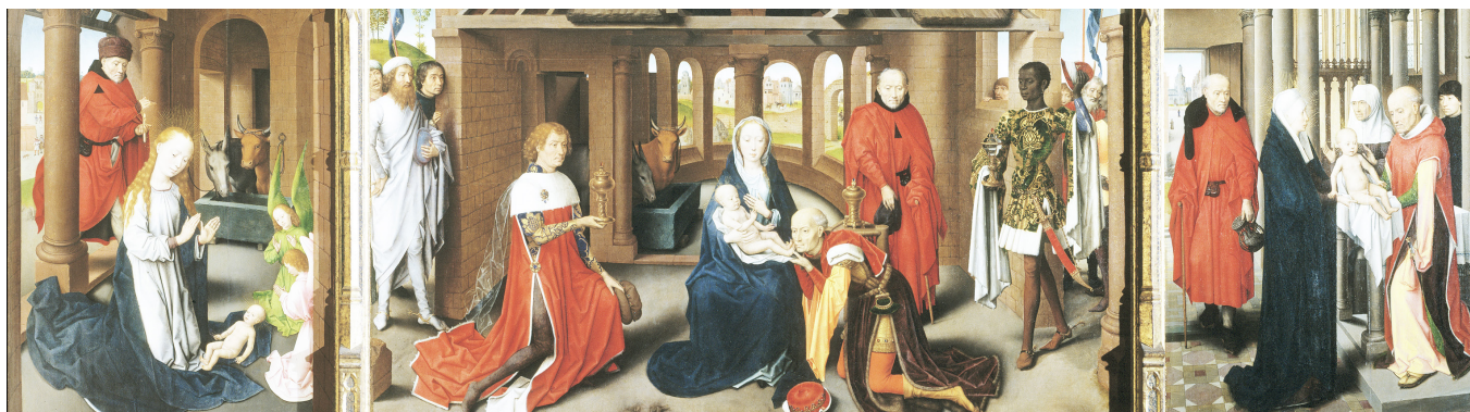
Adoració dels mags. Tríptic de l'Epifania, de Hans Memling. Oli sobre taula. Entorn de l'any 1480. Es troba al Museu del Prado. Es tracta d'una de les primeres imatges iconogràfiques en què el rei Baltasar és caracteritzat amb la pell negra.