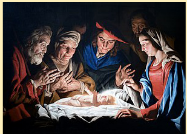
Adoració dels pastors, de Matthias Stomer (1632).

I a 1/4 d'UNA del migdia, Missa Solemne del dia de Nadal , a l'església parroquial.