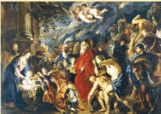
La Adoración de los Reyes Magos. Siglo XVII, obra de Pedro Pablo Rubens. Es troba al Museo del Prado, Madrid.

Divendres dia 6, Epifania del Senyor. Solemnitat. A les DEU del matí, Missa matinal. I a 1/4 d'UNA del migdia, Missa solemne , a l'església parroquial.