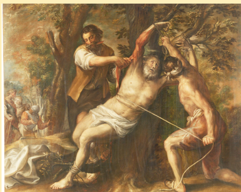
Martiri de Sant Bartomeu. José Rivera 1644. Es conserva al Mnac de Barcelona.

Dilluns dia 24, Sant Bartomeu, apòstol. Festa