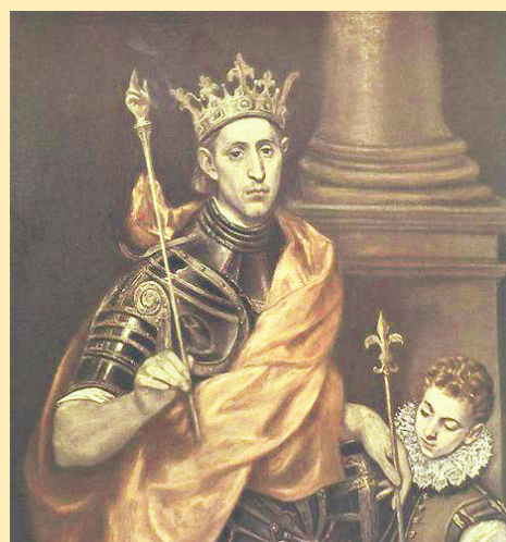
Sant Lluís, rei de França. El Greco 1592-1595. Es conserva al Museu del Louvre, Paris.

Diumenge dia 30, Sant Lluís, Rei de França. Memòria.