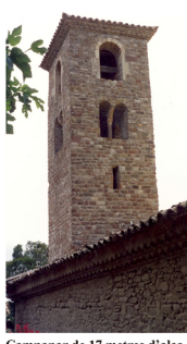
Campanar de 17 metres d'alçada, bastit al segle XII i cobert amb estructura de fusta i teula.

Entre 1723 i 1814 va servir d'església parroquial. Saquejada pels francesos els anys 1808 i 1809, l'any 1814, va ser a punt de ser ensorrada a causa de la picabaralla entre la gent del poble i els pagesos de la Barroca.