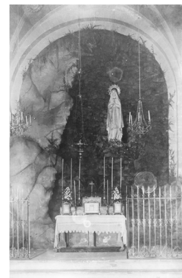
Imatge antiga del Santuari.

Hem editat un nou díptic informatiu sobre el Santuari de Lurdes adreçat als visitants. Elaborat amb els criteris del disseny actual que privilegien la visualitat, hi hem inclòs una breu notícia històrica. Al redós hi trobem la imatge de la Mare de Déu amb la pregària coneguda més antiga adreçada a la Mare del Crist, que data del segle III. El fulletó inclou una fotografia de l'interior del santuari abans de la reforma de l'any 1992 quan es va desmantellar la gruta.