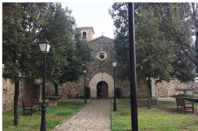
Santuari de la Mare de Déu de Lurdes de Tona

Parròquia Sant Andreu de Tona Tel. 93 812 40 77