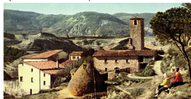
El Santuari, a mitjans del segle XX, enmig de camps de conreu.