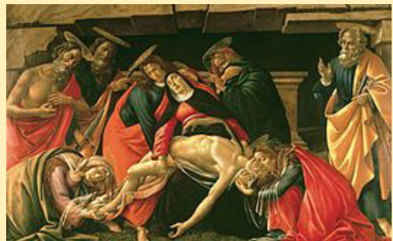
La mentació davant del Crist mort. Sandro Botticelli 1490–1492. Pintura al tremp sobre taula. 140 cm x 207 cm. Actualment a la Pinacoteca de Munich (Baviera).

A les NOU del matí, Via Crucis , al Santuari de Lurdes. A les CINC de la tarda, Acció litúrgica de la mort del Senyor , a l'església parroquial.