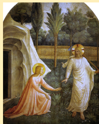
La resurrecció de Crist (1442). Fra Angélico. Fresc que es troba al convent de Sant Marc de Florència. 181x151 cm.

Missa del dia de Pasqua , a l'església parroquial.