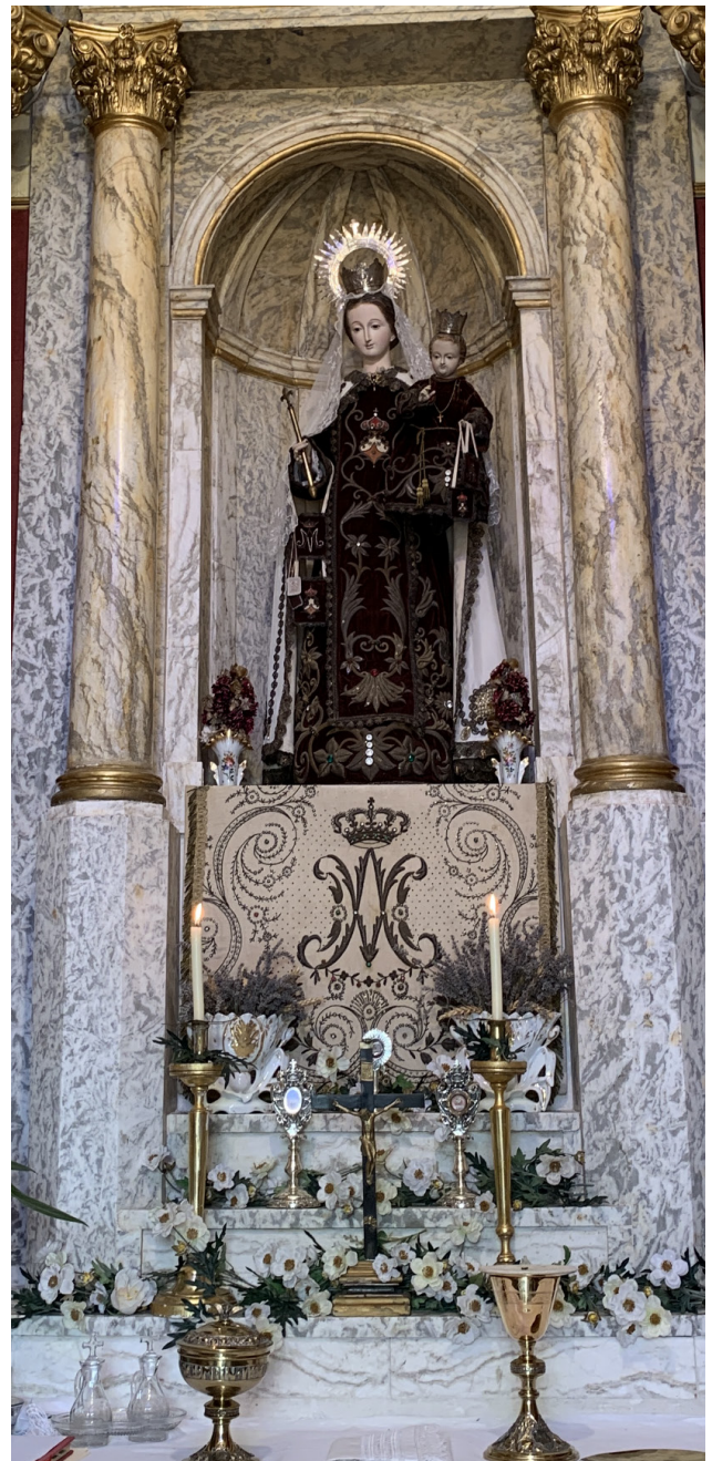
Oratori de la Mare de Déu del Carme de Riambau