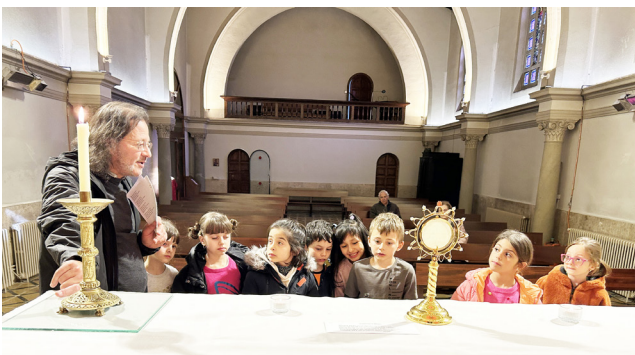
Els petits de la catequesi davant el Santíssim

En el nostre món, tan mediàtic, les estadístiques o la seva interpretació s'han convertit en brújules per l'economia i la política. En l'àmbit eclesial, les estadístiques podrien generar desànim. Però com que els cristians no perdem l'esperança i ens fiem més del petit ramat que de la massa, podem veure com passada la pandèmia, el nombre d'infants que s'inicien en la fe ha remuntat.